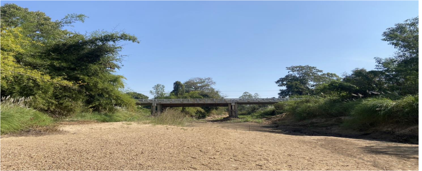
รูปตัดขวางลำน้ำ ปีน้ำ 2567 สถานี P.78 คลองขลุ้ง อ.คลองขลุ้ง จ.กำแพงเพชร